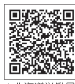
▲北海道労働局ホームページ