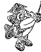
岩内町キャラクター「たろ丸」

岩内町、共和町、泊村、神恵内村、寿都町、島牧村、蘭越町、黒松内町のお仕事を町村別に掲載しております。また、求人情報誌は誌面のスペースの都合上、主な労働条件のみの掲載となっておりますのでご了承ください。