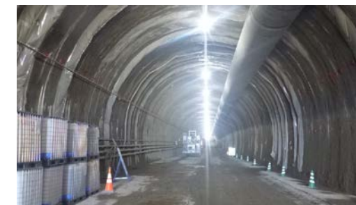
21.内浦トンネル(東川) 本坑状況