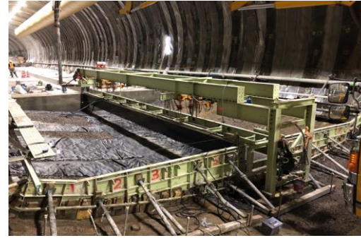
インバート型枠設置状況