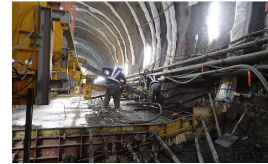
インバートコンクリート打設済状況