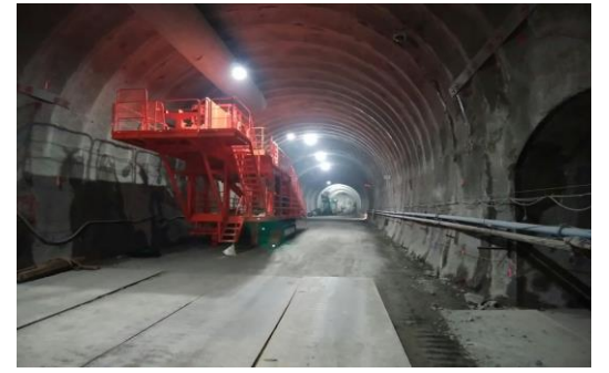
坑内ベルコン設置状況