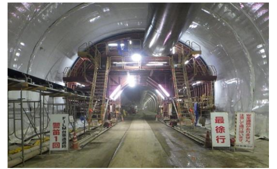
トンネル防水工設置済状況