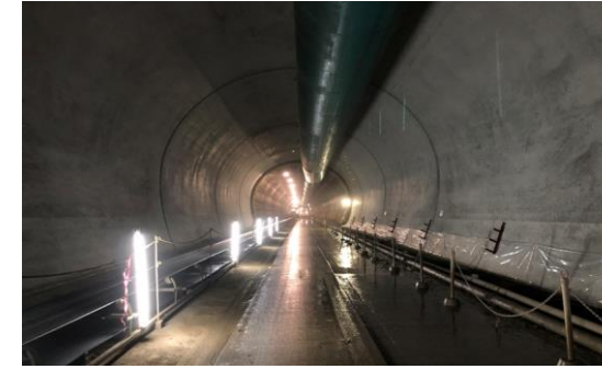
トンネル二次覆工打設済状況