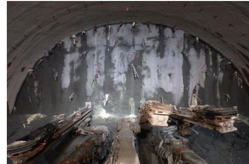
掘削補助工施工状況