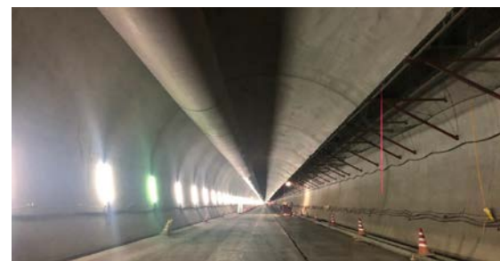
ニツ森トンネル(鹿子)他 覆工完了状況