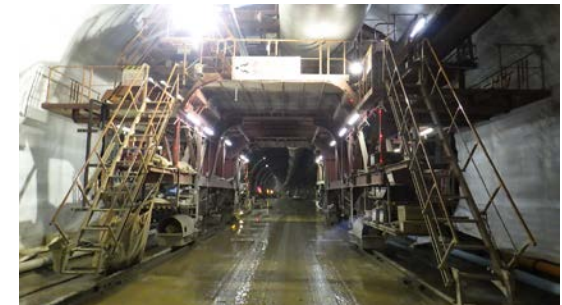
後志トンネル(塩谷) 切羽状況