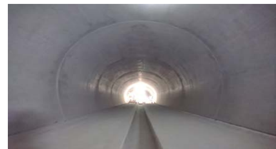
昆布トンネル(桂台)他 覆工施工状況